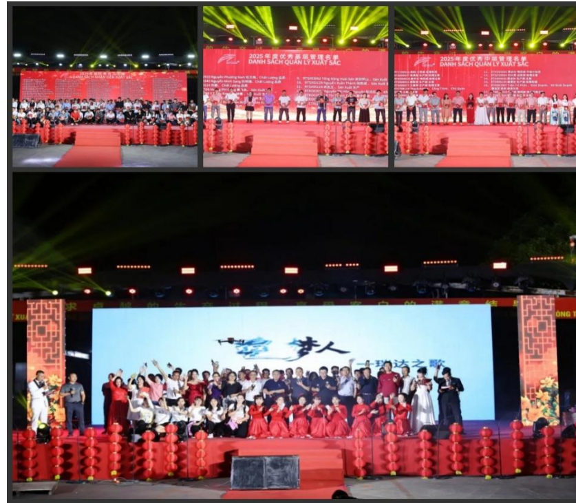
图为：瑞达春节联欢晚会暨表彰大会

公司本着“为国家分忧、为社会解难、为残疾人谋福利”的宗旨，尽可能多安排残疾人就业，在发展区域经济和安排残疾人就业方面做出了较大的贡献。多年来，公司十分关心残疾职工的工作和生活，将他们安排在力所能及及在岗位上，并与其他员工同工同酬，还不断改善职工工作和生活环境，为他们排忧解难，不断改善他们的福利待遇，让残疾员工有岗位、有信心、有尊严。